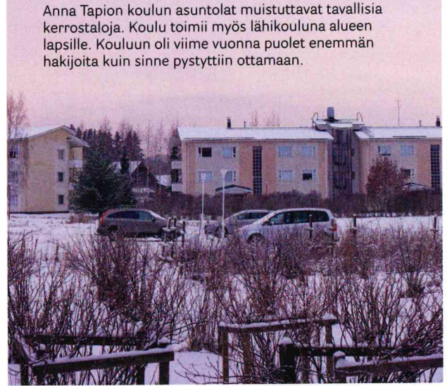
Anna Tapion koulun asuntolat muistuttavat tavallisia kerrostaloja. Koulu toimii myös lähikouluna alueen lapsille. Kouluun oli viime vuonna puolet enemmän hakijoita kuin sinne pystyttiin ottamaan.